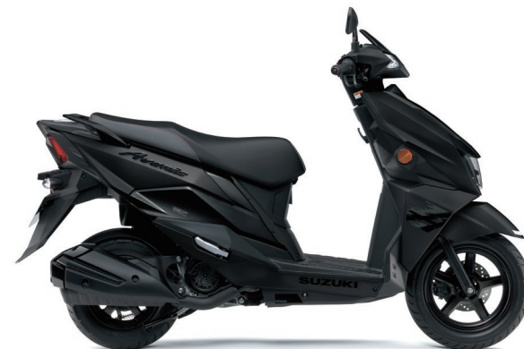
ガラスパークルブラック/マットブラックメタリックNo.2 (KGL)

アヴェニス125 メーカー希望小売価格(消費税10%込み) ¥284,900 (消費税抜き¥259,000)