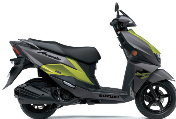
マットフィブロイングレーメタリック/ラッシュグリーンメタリック (CC8)