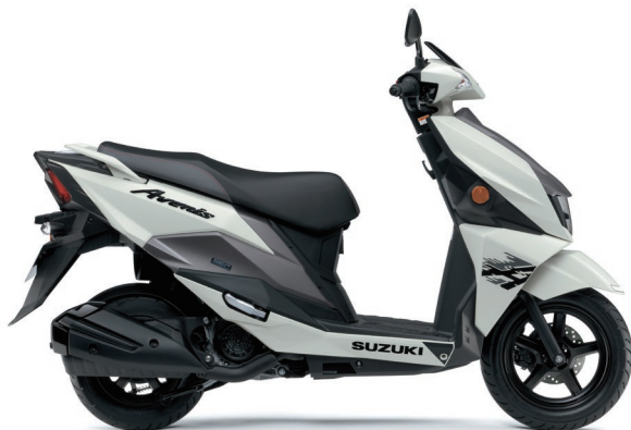
パールミラーホワイト/マットフィブロイングレーメタリック (A8D)