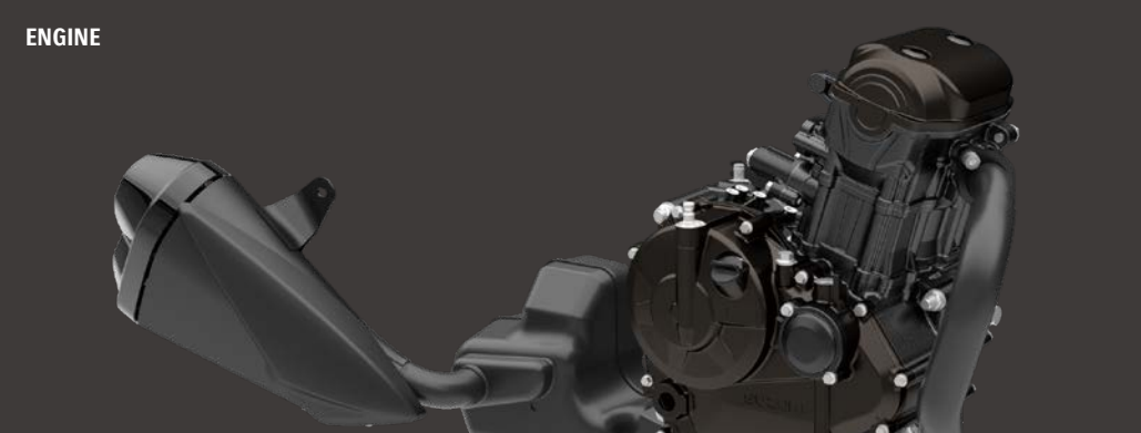
SUZUKI OIL COOLING SYSTEM (SOCS)