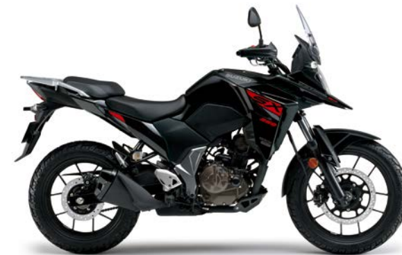
ガラススパークルブラック (YVB)

V-STROM250SX メーカー希望小売価格(消費税10%込み) ¥591,800 (消費税抜き¥538,000)