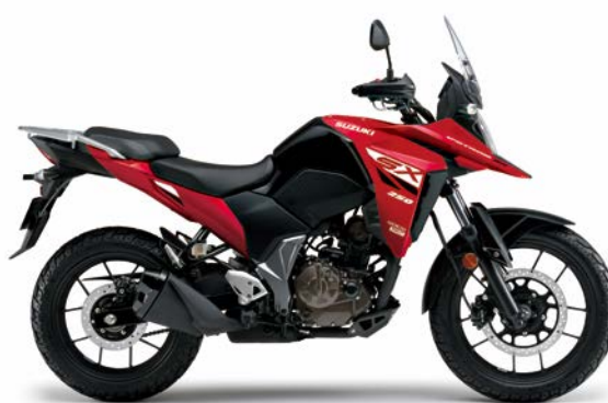
ソノレドメタリック (QSB)