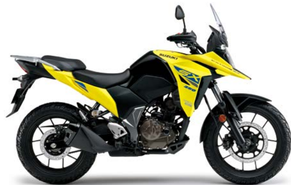
チャンピオンイエローNo.2 (YU1)