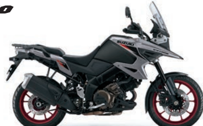
オールドグレーメタリック No.3/ マットブラックメタリック No.2(BN8)