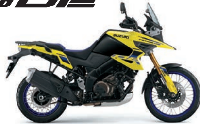
チャンピオンイエロー No.2/グラススパークルブラック(BT1)