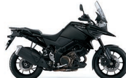
グラススパークルブラック/ マットブラックメタリック No.2(C4X)