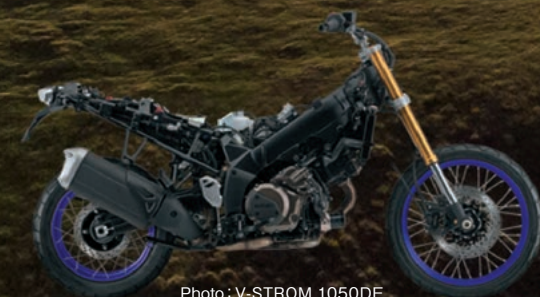
Photo: V-STROM 1050DE

軽量コンパクトなシャーシは、快適な走り心地を提供。スリムなVツインエンジンとともに、シートとフェューエルタンクもスリムにデザインすることで、良好な足つき性を実現。ライダーの使用状況や好みに合わせた選択をできるようV-STROM 1050DEを設定。V-STROM 1050はオンロードでの長距離走行や快適性に、より重点を置いた設計とした。これに加えV-STROM 1050DEは、様々なニーズに応え、ライダーの行動範囲を広げてグーベルライディングも楽しめるような仕様とした。