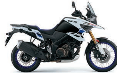
パールテックホワイト/グラススパークルブラック(CK6)