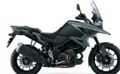
マットスティールグリーンメタリック/ マットブラックメタリック No.2(CWY)

■メーカー希望小売価格には、保険料・税金(消費税を除く)・登録などに伴う諸費用は含まれておりません。 ■メーカー希望小売価格は参考価格です。販売価格は各販売店が独自に定めていますので、詳しくは販売店にお問い合わせ下さい。 ■メーカー希望小売価格は消費税10%にもとづく価格です。