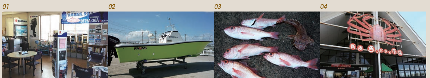
01 クラブハウスでは、出航前や帰港後にゆっくりすることが可能。大きなマリーナではないが、アットホームできめ細かなサービスが行き届いている 02 富山湾には、とっておきのポート天国が待っている。まずは、会員制マリナクラブでレンタルボートを利用して楽しむのも一つの方法だ 03 1,000メートルを超える水深まで一気に落ち込む富山湾は、さまざまな魚種の宝庫。ボートアングラーにはたまらない。写真はノドグロ(アカムツ) 04 近隣のエリアは、海王丸パークや新湊きつと市場(写真)など、市民や観光客が海に親しむためのエリアとして整備が進んでいる